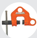
GARRA DE HUSILLO MODELO WF Pág. 51