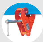
PINZAS DE ANCLAJE MODELO BC Pág. 25